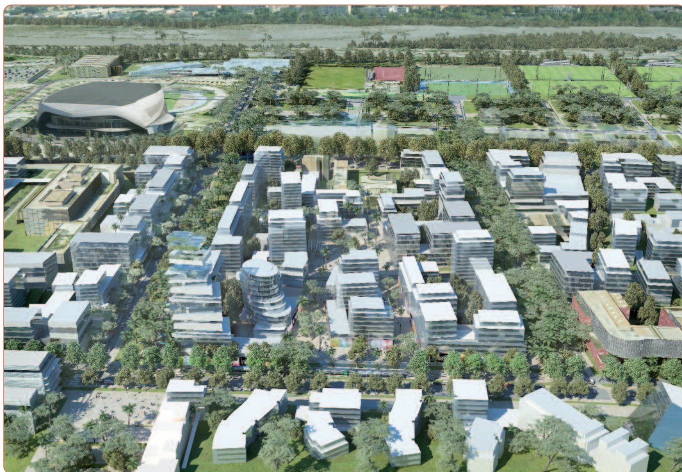
Esquisse d'une possible composition urbaine

En favorisant le développement et en dynamisant la vie urbaine locale, l'université offre une place de choix aux étudiants en leur permettant de s'ancrer dans la ville. Elle encourage la création d'un lien durable entre les futurs acteurs économiques et la ville en devenant vecteur de développement urbain, au service de la ville. La création d'une centralité aux abords d'un large espace public et paysager ouvert à tous renforcera l'attractivité déjà existante du lieu et constituera un véritable espace de vie au cœur du quartier. La présence de nombreux équipements sportifs au sein du périmètre sera l'une des originalités majeures du projet.