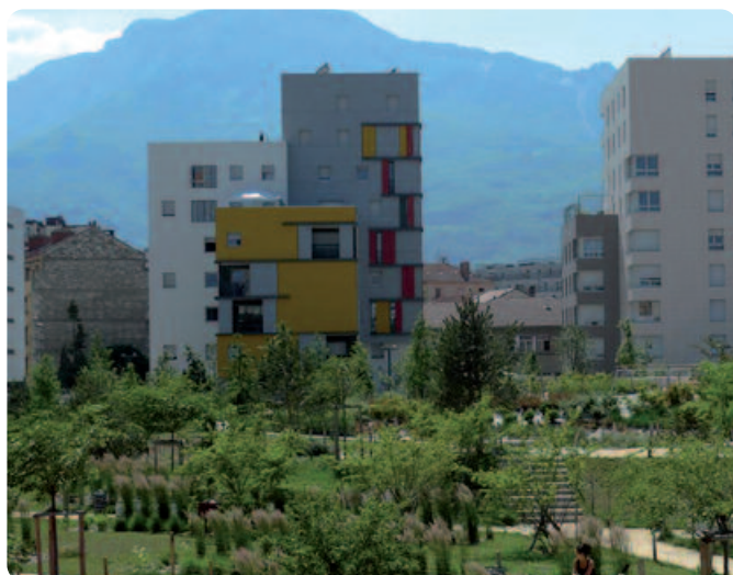
Grenoble. Écoquartier ZAC de Bonne, projet urbain