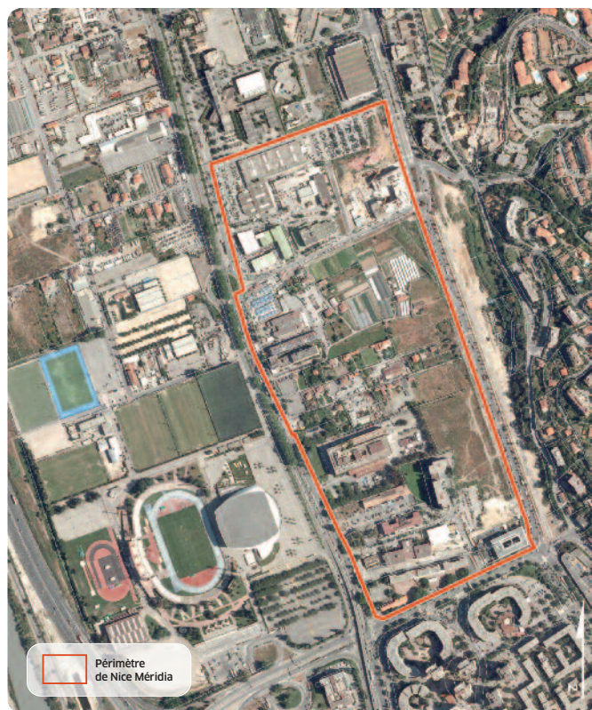
Périmètre de Nice Méridia