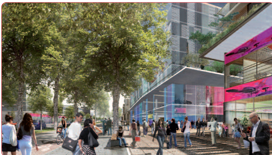
Image d'ambiance de la future avenue de Grenoble

Au titre de la démarche ÉcoCité, Nice Méridia participe à la mise en œuvre de certaines actions, dont notamment l'action "Smart Grid" visant à une gestion optimale et locale de la distribution de l'électricité. En phase de présélection, l'action "Monitoring urbain" a pour objectif de concevoir des services pour mieux gérer la ville, faciliter la vie des habitants et rendre le fonctionnement urbain plus intelligent.