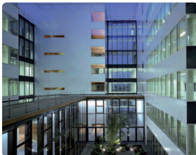
Paris. ZAC Rive Gauche, immeuble de bureaux